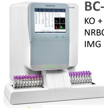
BC-6000 OV | CT KO + 5-DIFF, NRBC, IMG