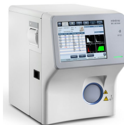
BC-30 Vet KO + 4-DIFF aspirace 9 µl krve